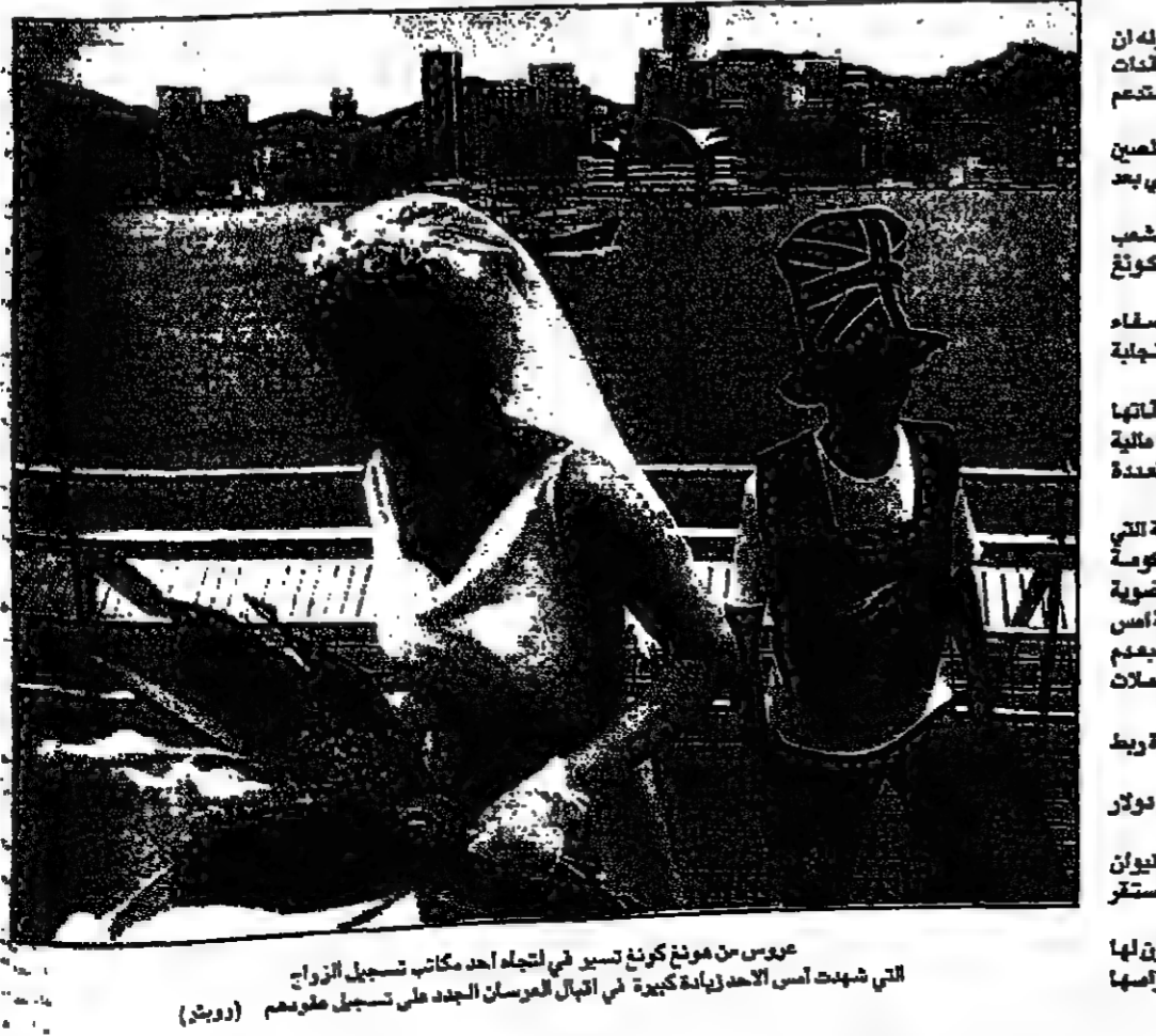
عموم من هونغ كونغ تسير في اتجاه أحد مكاتب تسجيل الزواج التي شهدت أمس الأحد زيادة كبيرة فيقبال العرسان الجدد في تسجيل طفرتهم

باريس - رويترز: منح بنك الجزائر المركزي السبت ترخيصا لإنشاء ثاني بنك خاص في البلاد. وقال البنك المركزي ان هذا البنك الجديد سيوفر خدمات مصرفية إضافية للمواطنين.